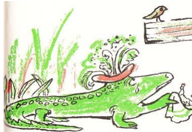
Imagem extraída de Lágrimas de crocodilo , de André François.

6.1. Será que o significado desta expressão tem alguma relação com o que o crocodilo da nossa lenda sentiu?