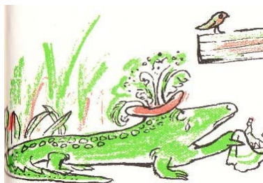
Imagem extraída de Lágrimas de crocodilo , de André Françaes.

6.1. Será que o significado desta expressão tem alguma relação com o que o crocodilo da nossa lenda sentiu? _Não_