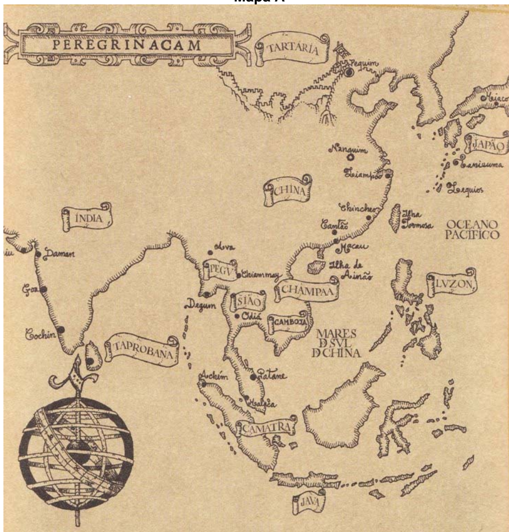
In Peregrinação, Edição Expresso, Ilustração de Carlos Marreiros.