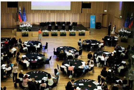
Evento de encerramento (Eslovénia)