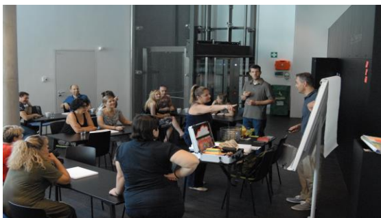
Seminário de formação de professores

Agora, mais do que nunca, estou preparada para mudar do ensino tradicional para uma abordagem do ensino baseada em projetos, ajudando os meus alunos a desenvolver a sua criatividade, a capacidade de gerar ideias e transformá-las em ação, aprender a trabalhar em equipa, ter iniciativa e aceitar responsabilidades. Tal como disse Albert Einstein: “ Se sempre fizeres o que sempre fizeste, terás sempre o que sempre tiveste ”.”