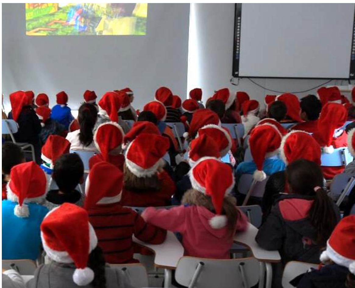
Formação de públicos para o cinema – Sessões de cinema de animação em contexto escolar, no âmbito do PNC, para alunos do Pré-Escolar e do 1.º Ciclo, no agrupamento de Escolas Ovar Sul.

Em finais do 1.º período letivo, a equipa do PNC, operacionalizada pela Direção-Geral da Educação, pelo Instituto do Cinema e do Audiovisual e pela Cinemateca Portuguesa-Museu do Cinema, vem desejar BOAS FESTAS a todas as equipas do PNC a nível de escola e às respetivas comunidades educativas. Aproveitamos também para partilhar algumas informações e iniciativas que marcaram os meses de novembro e dezembro.