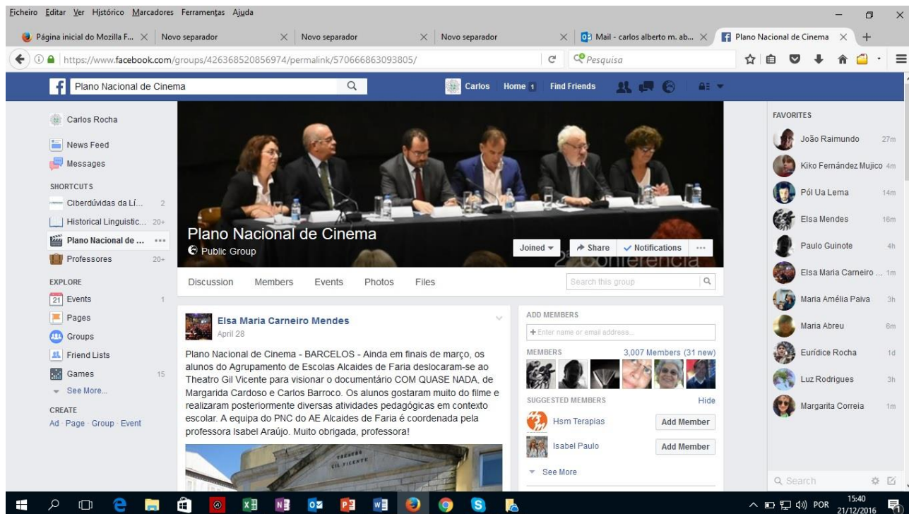
Wall do grupo público do PNC na rede social do Facebook

Não podemos deixar de sublinhar que o grupo público do Plano Nacional de Cinema no Facebook tem funcionado como um dos pontos de encontro mais procurados para divulgação de atividades realizadas pelos Agrupamentos de Escolas e Escolas não Agrupadas que participam no Plano Nacional de Cinema (PNC). Já ultrapassámos os 3.000 membros e crescemos praticamente todos os dias! Visitem-nos e divulguem o grupo, que se encontra acessível em: https://www.facebook.com/groups/426368520856974/?pnref=story