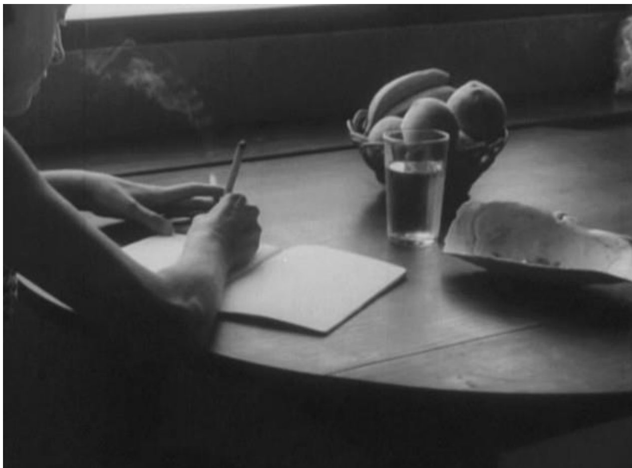
Fotograma de Sophia de Mello Breyner Andresen (1969), de João César Monteiro