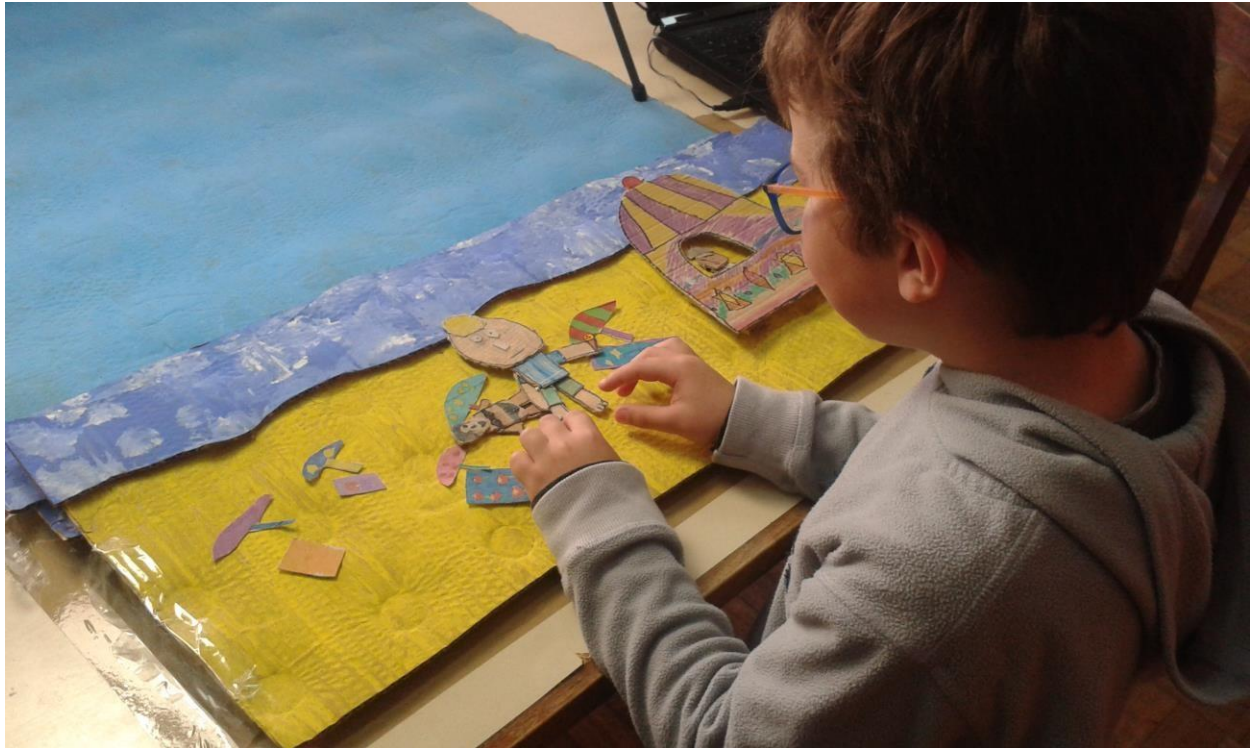
Desenvolvimento do projeto «A Praia de Espinho».

O filme «A Praia de Espinho» na competição do IndieJúnior Allianz - A curta-metragem de animação «A Praia da Espinho», filme realizado pelos alunos do 2º ano da Escola Básica nº 3 de Espinho, no âmbito do projeto «Crianças Prime1ro», desenvolvido pelo serviço educativo do Cinanima com o apoio do PNC, e orientado pelo professor Paulo Fernandes, foi o único filme português presente na competição da 1ª Edição do Festival Internacional do IndieJúnior Allianz, que decorreu na cidade do Porto, na competição internacional de curtas-metragem para um público com mais de 3 anos. A notícia foi divulgada no Diário de Notícias , em: http://www.dn.pt/artes/interior/indie-ja-e-festival-de-cinema-para-os-mais-novos-5648626.html