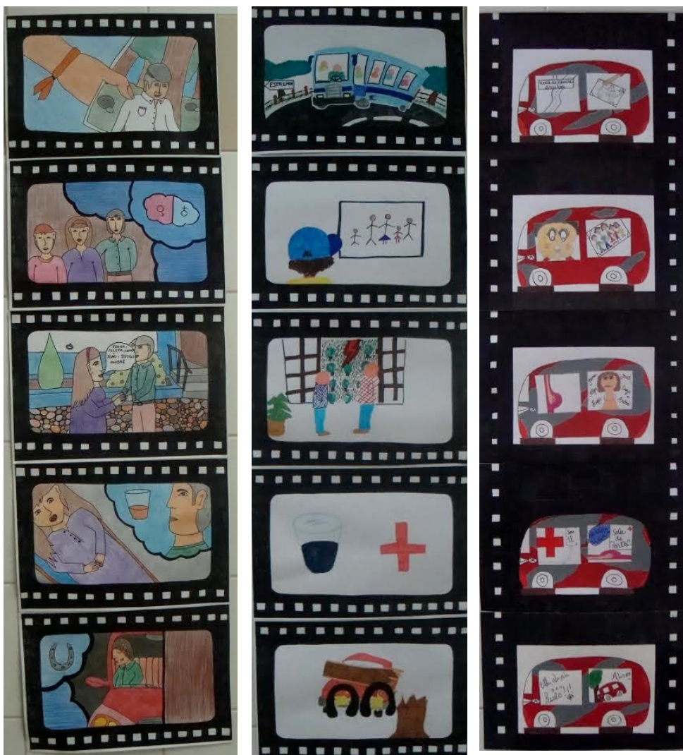
Imagens: Trabalhos realizados pelos alunos a partir do visionamento de Atrás das Nuvens .

No AE de Fronteira, a equipa do PNC planificou uma atividade a partir do visionamento do filme Atrás das Nuvens , de Jorge Queiroga. O filme foi visionado por alunos do 1.º, 2.º e 3.º ciclos do Ensino Básico, e, após o seu visionamento, foi proposto aos alunos que contassem o filme através de imagens. O resultado dessa proposta esteve na origem de uma exposição de trabalhos de alunos organizada na Escola. O nosso obrigado à professora Lurdes Deodato, coordenadora da equipa PNC no AE de Fronteira!