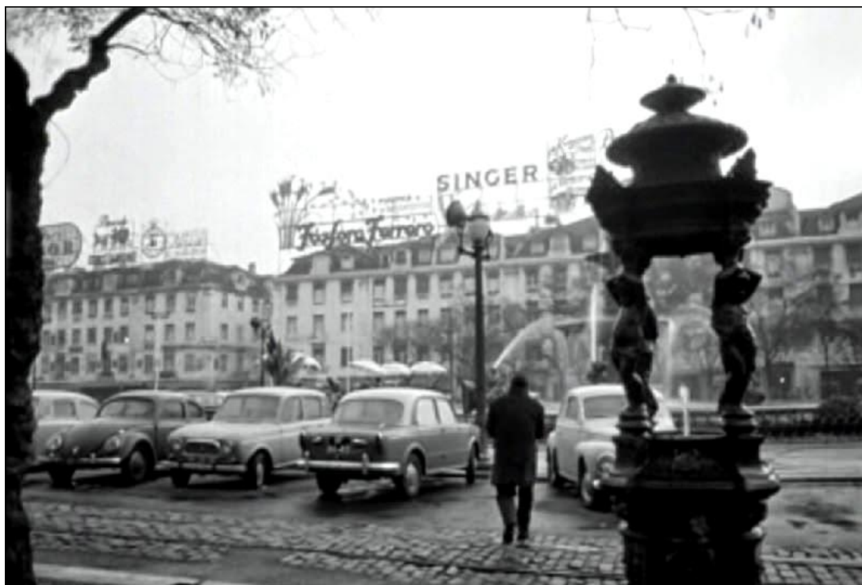
Fotograma de Belarmino (1964), Fernando Lopes

Lembramos que o Plano Nacional de Cinema é dinamizado pela Direção-Geral da Educação (DGE), pelo Instituto do Cinema e do Audiovisual (ICA) e pela Cinemateca Portuguesa-Museu do Cinema.