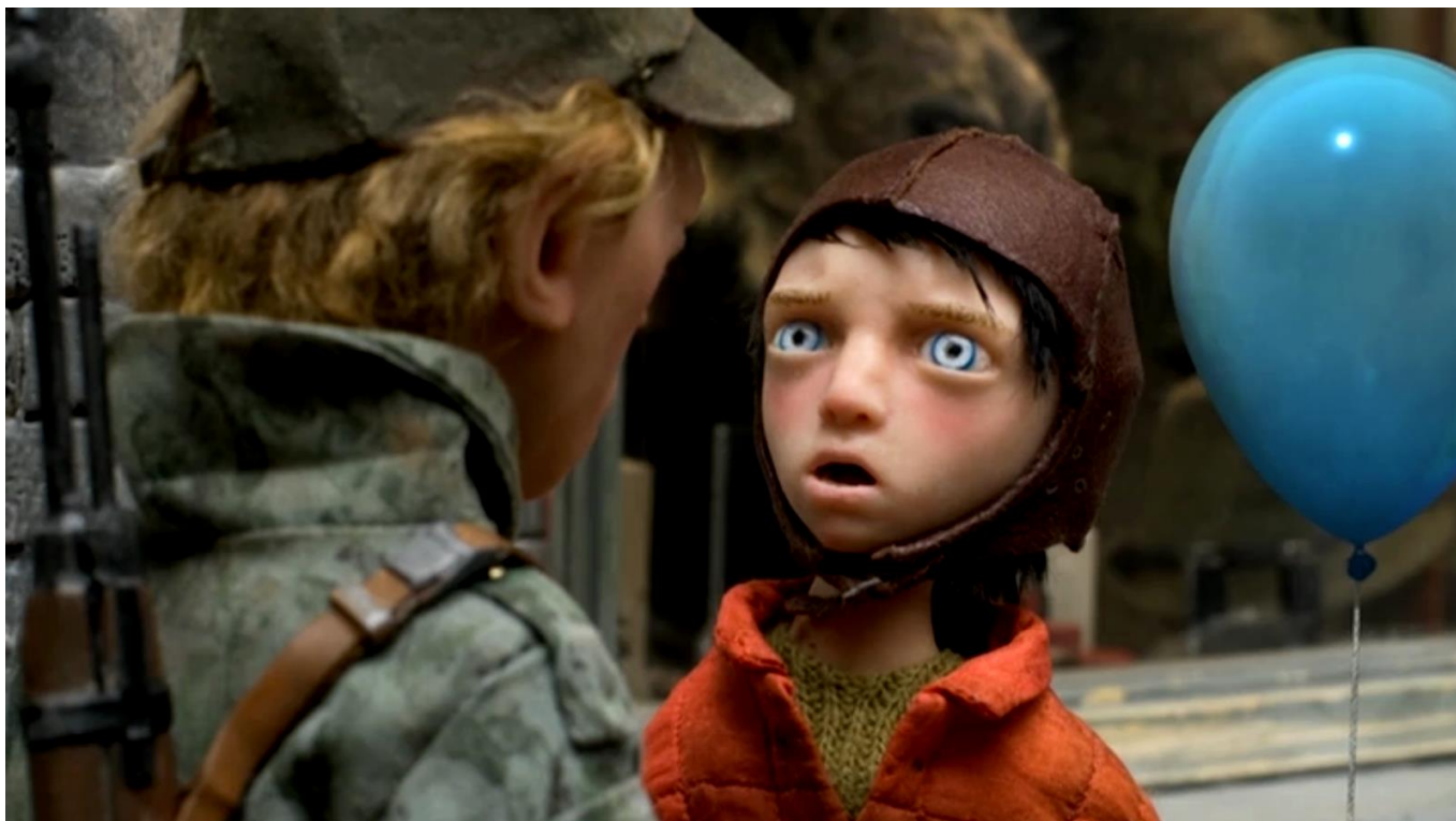
Fotograma de Pedro e o Lobo , de Suzie Templeton

Externato Cooperativo da Benedita (Alcobaça) - No passado dia 5 de janeiro, cerca de 300 alunos dos 7º e 8º anos do Ensino Básico do Externato Cooperativo da Benedita assistiram à exibição do filme de animação Pedro e o Lobo , de Suzie Templeton.