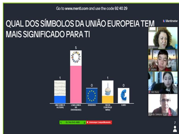
Importância dos Símbolos da UE – Mentimeter – Foto: Carla Aleixo