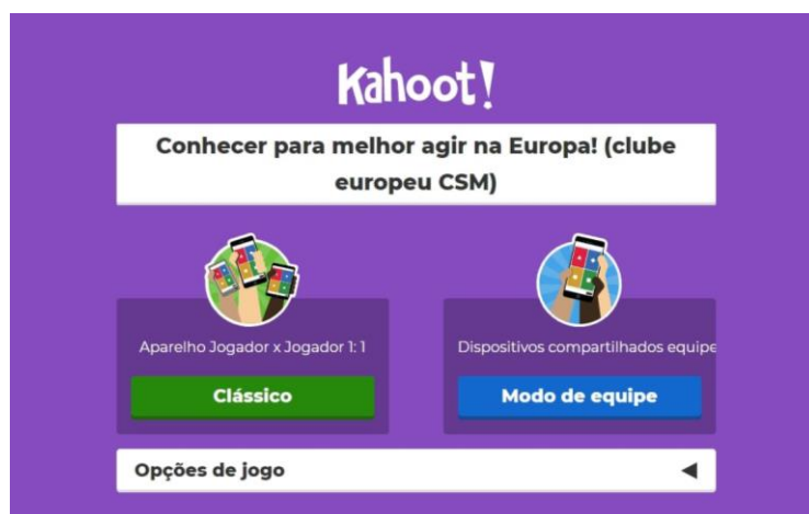
Início do jogo digital - Foto: Rute Simões