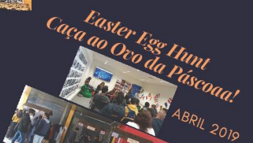
Easter Egg Hunt Caça ao Ovo da Páscoa! ABRIL 2019