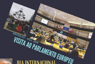
BRUXELAS - NOV 2018 VISITA AO PARLAMENTO EUROPEU