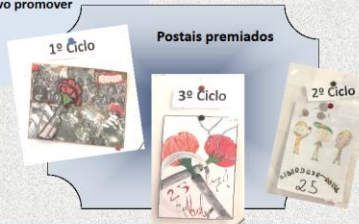
EXPOSIÇÃO DOS POSTAIS ELABORADOS PELOS ALUNOS DO 1º, 2º E 3º CICLOS

CONSTRUÇÃO DE MAQUETAS REPRESENTATIVAS DA DEMOCRACIA GREGA— com criatividade e imaginação, os alunos construíram "réplicas" dos símbolos representativos da Democracia ateniense do séc. V a.C.