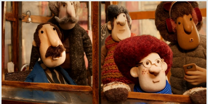
Fotogramas de Tio Tomás, a contabilidade dos dias , de Regina Pessoa, Nestor , de João Gonzalez e O peculiar crime do estranho Sr. Jacinto , de Bruno Caetano.