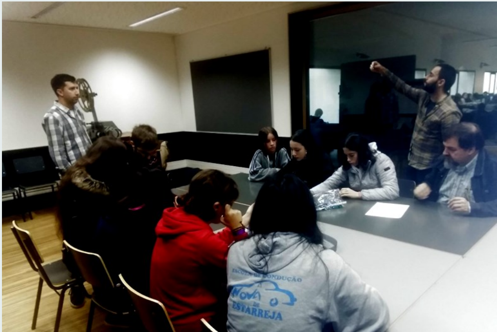
7 de novembro, Workshop de Pintura em Película para alunos da ES de Estarreja.

Agradecemos a partilha da Dra. Manuela Ressurreição!