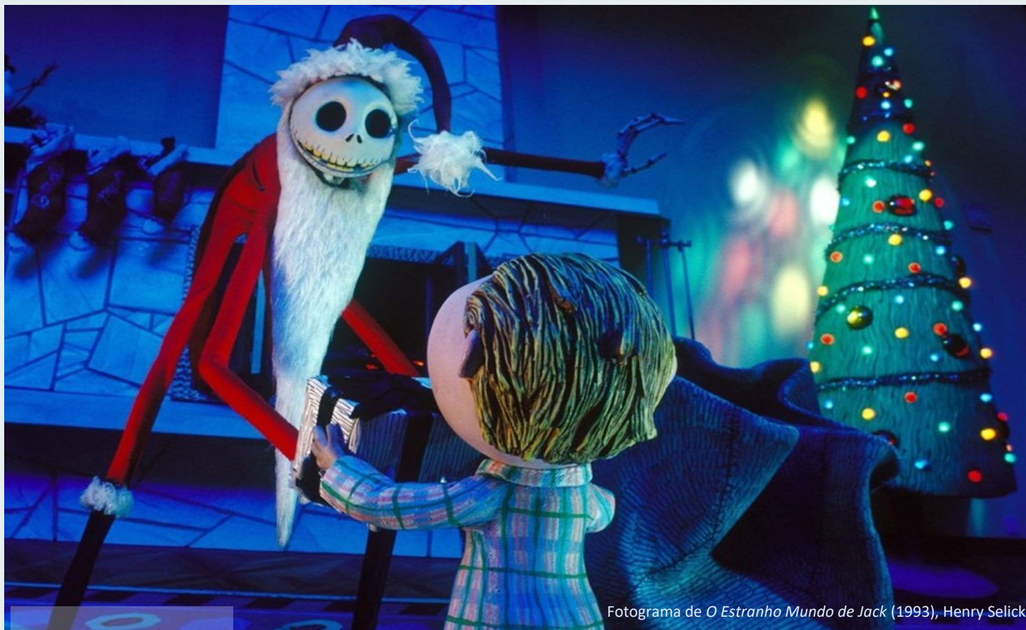
Fotograma de O Estranho Mundo de Jack (1993), Henry Selick

Deixamos a todas as comunidades educativas os votos de BOAS FESTAS!