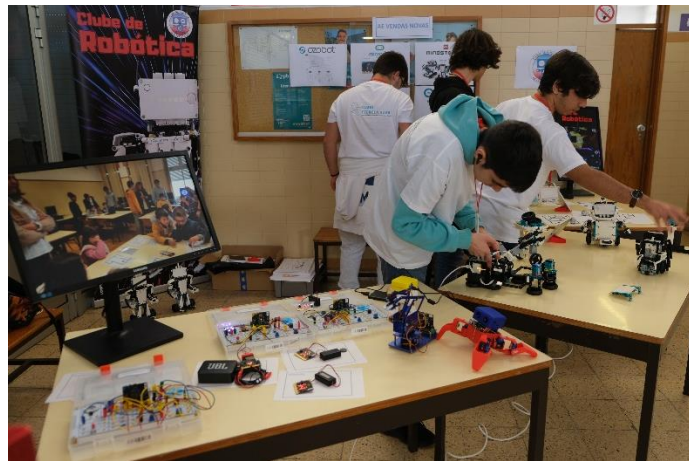
Mostra de projetos