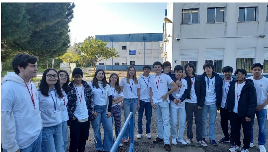
Receção pelos alunos da Escola Secundária de Vendas Novas