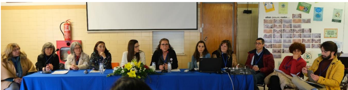
Mesa-redonda com coordenadores CCvE e Centro Ciência Viva do Lousal