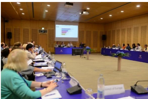
Reunião do Comité do Genocídio dos Roma, 13 de junho de 2023, DarPro

No artigo 4.º da Declaração Ministerial da International Holocaust Remembrance Alliance (IHRA) de 2020 , os países-membros comprometeram-se a: «Remember the genocide of the Roma. We acknowledge with concern that the neglect of this genocide has contributed to the prejudice and discrimination that many Roma communities still experience today».