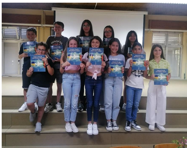
Turma do 5.º A do Agrupamento de Escolas Gil Vicente

Quantas palavras existem no mundo - Colégio do Sagrado Coração de Maria - Lisboa