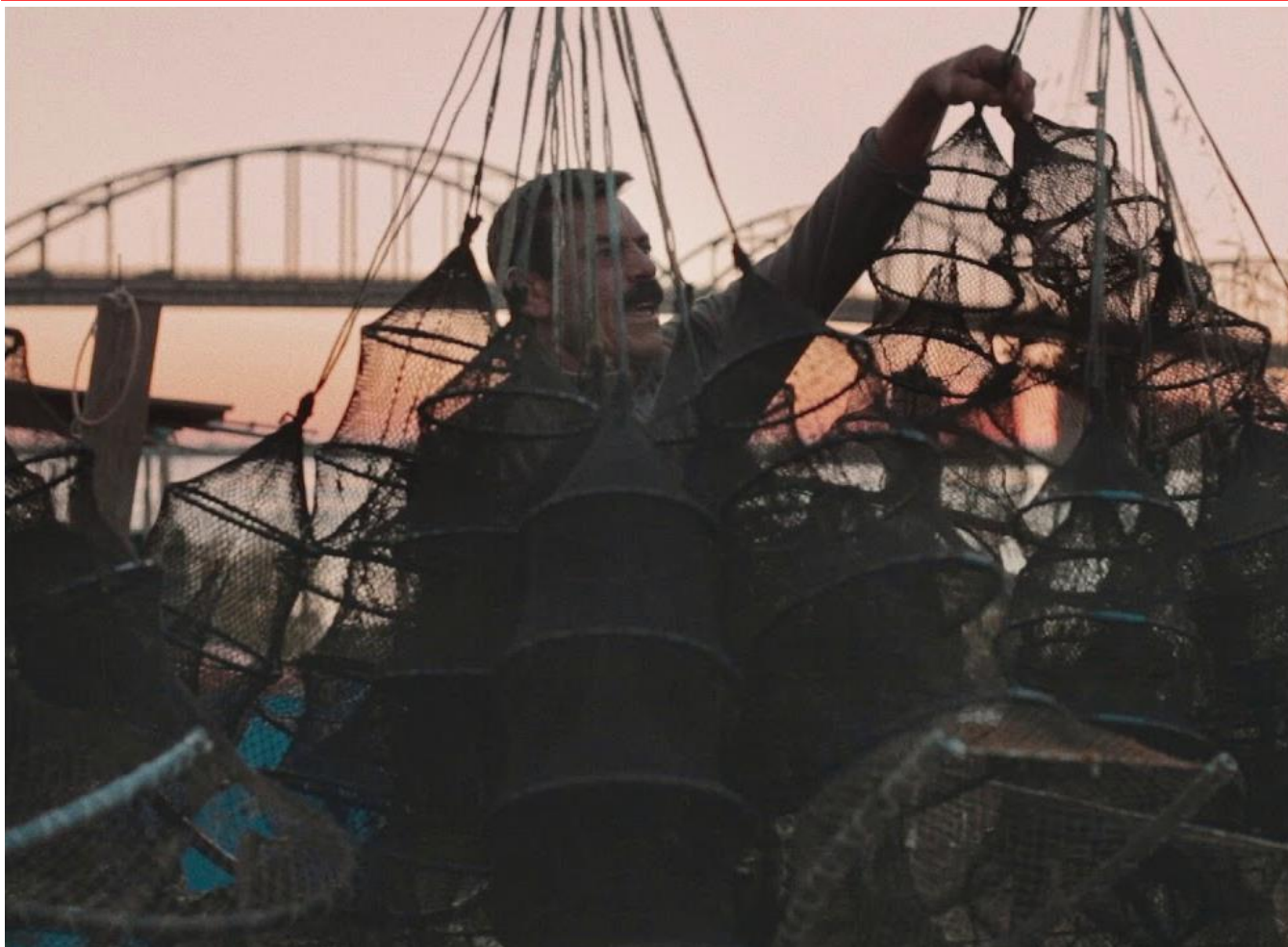
Fotograma de Terra Franca (2018), de Leonor Teles

Neste início do ano 2019, a equipa nacional do Plano Nacional de Cinema (Direção-Geral da Educação, Instituto do Cinema e Audiovisual e Cinemateca Portuguesa-Museu do Cinema) saúda todas as escolas, retomando a divulgação das principais atividades cinematográficas que têm vindo a ser desenvolvidas pelas comunidades educativas. Se, por um lado, destacamos projetos e atividades em que a arte do cinema tem sido escolhida como interlocutora privilegiada, por outro, valorizamos igualmente dinâmicas de articulação/colaboração de atividades de índole cinematográfica com projetos realizados no âmbito da Estratégia Nacional para a Cidadania e/ou no quadro de implementação de práticas de inclusão da vida das escolas.