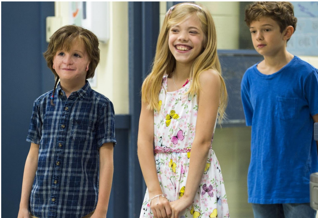
Fotograma de Wonder (2017), de Stephen Chbosky