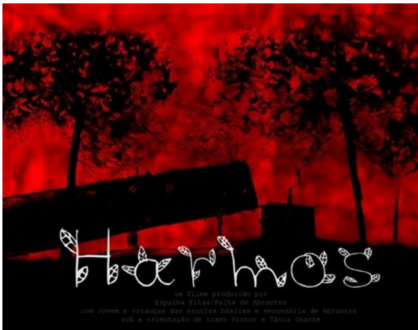
Cartaz de Harmos (2018)

Em 8 de dezembro de 2018, no Centro Cultural Gil Vicente, no Sardoal, numa sala cheia de alunos, pais e professores, foi apresentado o filme Harmos , um filme de animação realizado por um coletivo de crianças e jovens de escolas da área de Abrantes. Neste mesmo ano, a 42.ª Edição do Festival Internacional Cinanima distinguiu Harmos na categoria de melhor obra feita por realizadores menores de 18 anos. Produzido pela Associação Palha de Abrantes e o Cineclube Espalhafitas , Harmos já tinha ganho a competição de melhor curta de animação feita em escolas, na categoria oficinas do Prémio Nacional de Animação. Com cerca de 10 minutos, a curta-metragem aborda a relação do Homem com a floresta. Trata-se de um projeto vasto e extremamente importante, que é desenvolvido há mais de uma