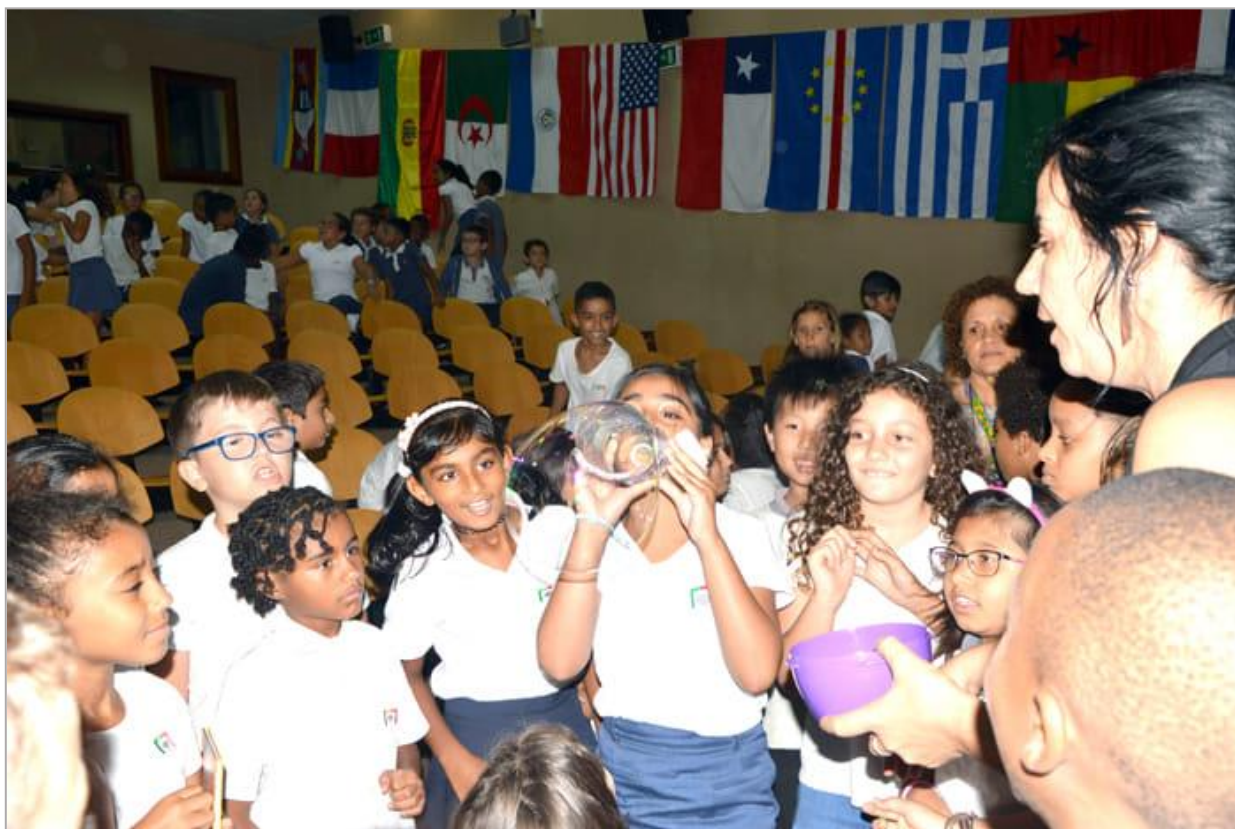
Sessão de Cinema na EPM-CELP (Maputo), em dezembro de 2018.

http://www.epmcelp.edu.mz/index.php/noticias/artes/1995-cinema-filme-papel-de-natal-estimulou-consciencia-ecologica-em-tempo-de-consumismo?fbclid=IwAR0vWMrjxLnHil4XKU7AJ9G7VqUNA_eqsISud-befahoGTvPYaWmInoFyJ8