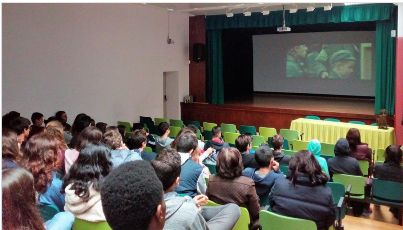
Sessão de cinema no Auditório do AE de Peniche /PNC/ AE de Peniche