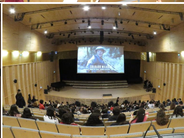
Fotograma de Soldado Milhões (2018), Gonçalo Galvão Teles e J. Paixão da Costa; cartaz alusivo ao evento, e sessão no auditório da Escola.