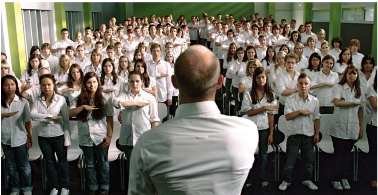
Fotograma de A Onda (2008), de Dennis Gansel

Facilmente as pessoas podem ser manipuladas e induzidas em erro, como mostra o filme. Ao tentarem a união e a inclusão das pessoas no grupo, excluíam quem não concordava com o movimento, minimizando-os e esquecendo que o motivo inicial era a união e a aceitação.